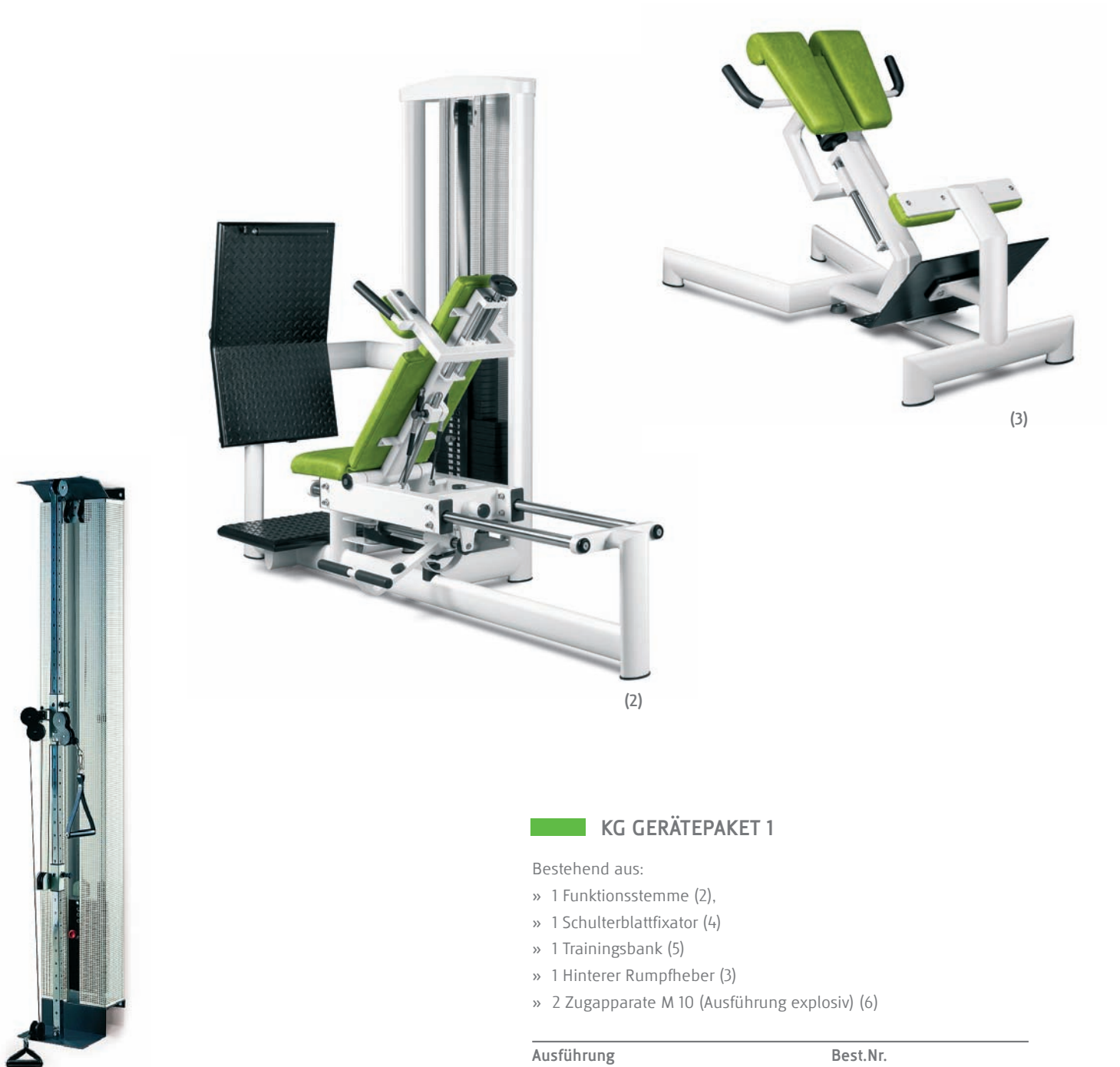
(1) Zugapparat M 20 (Wandmodell)

Beide KG-Gerätepakete sind in ihrer Funktionalität weitgehend identisch, unterscheiden sich jedoch in der Ausstattung der Geräte.